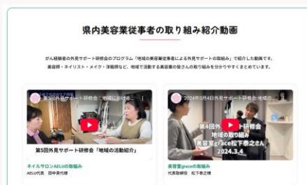
—動画— 体験談・専門職の声